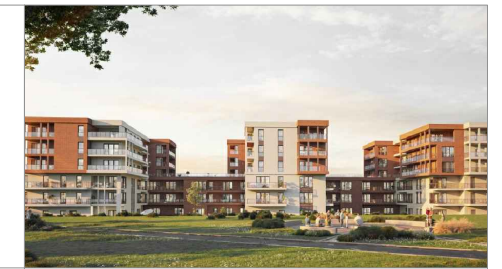
parter lokalizacja mieszkania